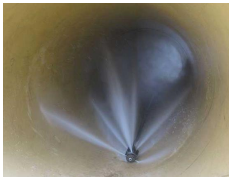
Kanalreinigungsdüse im Einsatz

Zur Beseitigung der Ablagerungen gleitet eine Reinigungsdüse langsam vom Fahrzeug aus durch den zu reinigenden Kanal. Dabei gibt es einen Vorschub durch den Hochdruckwasserstrahl. Beim anschließenden Zurückziehen der Düse wird das gelöste Material vor der Düse zum Fahrzeug hin transportiert. Dort wird es mit Hilfe eines Saugschlauches aufgenommen.